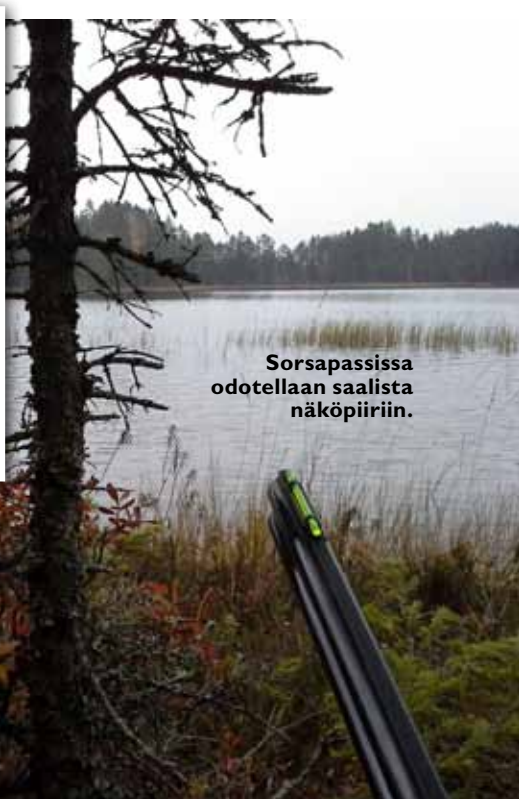
Sorsapassissa odotellaan saalista näköpiiriin.