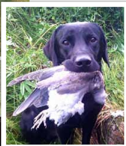
Saalis palkitsee emäntänsä, mutta myös koiran.

Sykähdyttävimmäksi kokemukseen Laakkonen mainitsee ensimmäisen kerran, kun lähti yksin kyyhkypassiin syksyn metsästykskauden alussa.