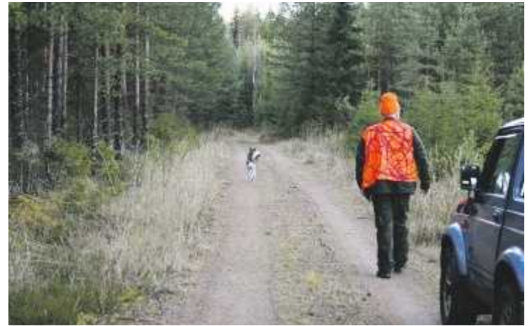
Yleensä metsästyliikenteen tie- ja käyttömaksut eivät kohoa kovin suuriksi.